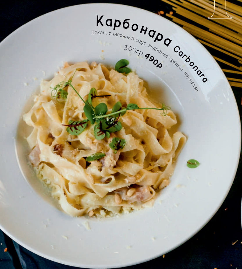
Карбонара Carbonara Бекон, сливочный соус, кедровые орешки, пармезан 300гр 490P