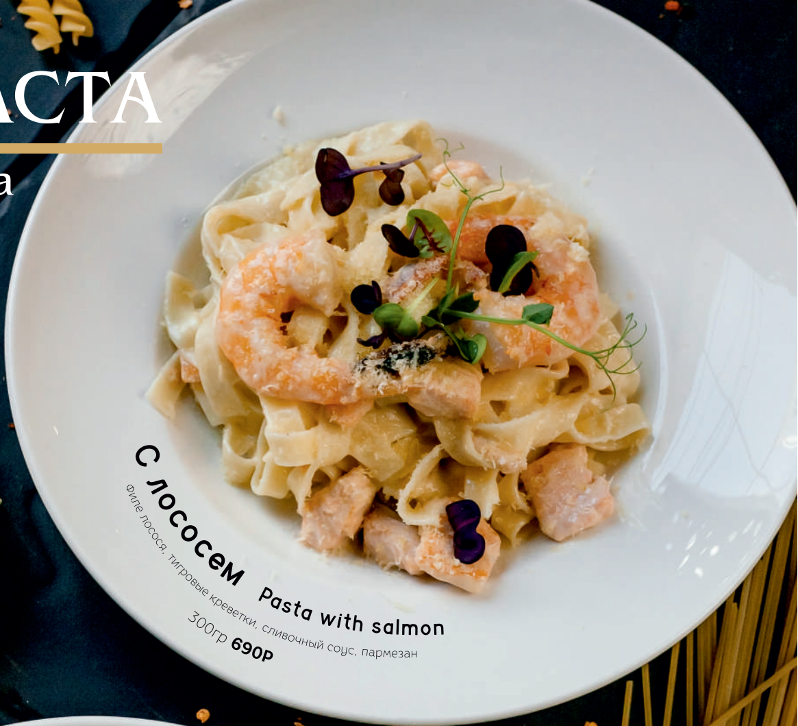
С лососем Pasta with salmon Филе лосося, тигровые креветки, сливочный соус, пармезан 300гр 690р