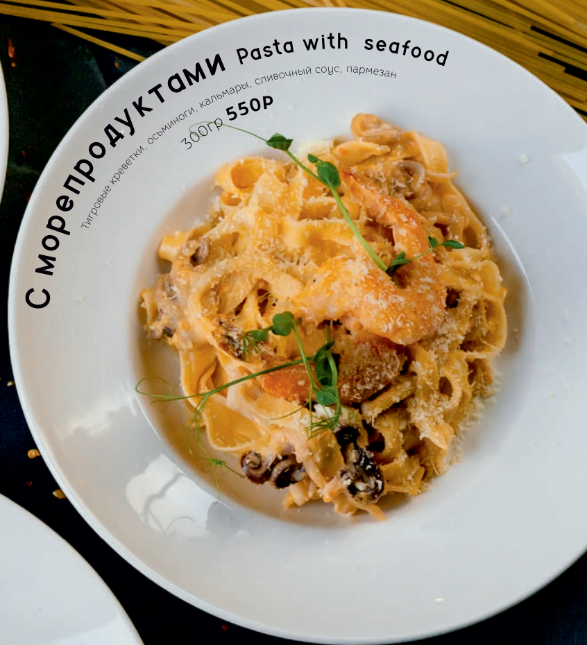
С морепродуктами Pasta with seafood Тигровые креветки, осьминоги, кальмары, сливочный соус, пармезан 300гр 550P