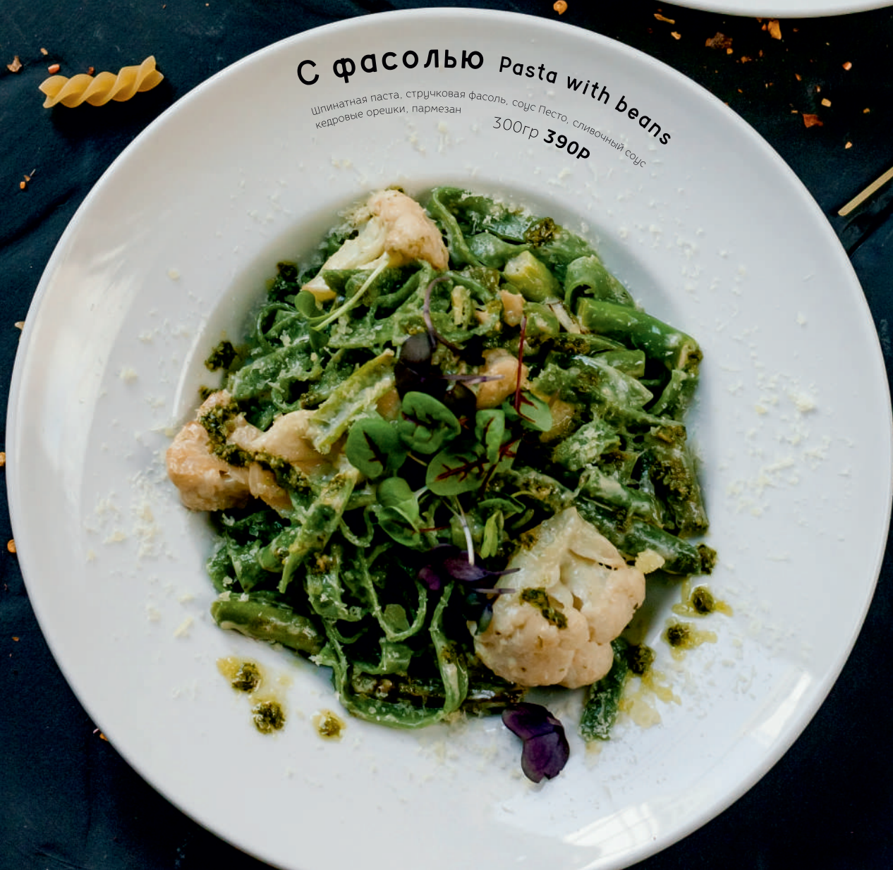
С фасолью Pasta with beans Шпинатная паста, стручковая фасоль, соус Песто, сливочный соус, кедровые орешки, пармезан 300гр 390р